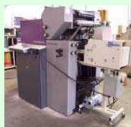
C9000 installato su Heidelberg Quick Master