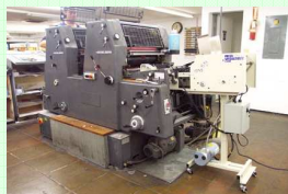
C9000 installato su Heidelberg GTO