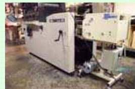
C9000 installato su Toko R2