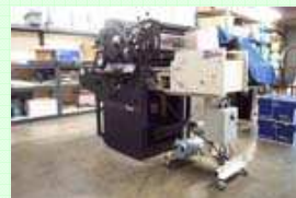
C9000 installato su A B Dick 9870