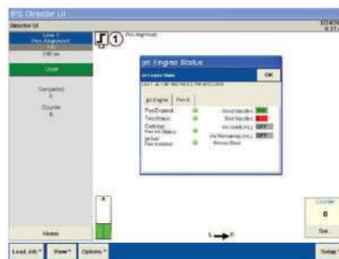
IPS Director—Carica e gestisce i lavori

Il software Director è caricato sull'Interfaccia Utente e da accesso alla configurazione, al controllo ed al monitoraggio della stampante. L'interfaccia permette all'utente di monitorare un'ampia gamma di dettagli di produzione, tra cui i tipi di lavoro, i conteggi, l'utilizzo dell'inchiostro, tutto in tempo reale.